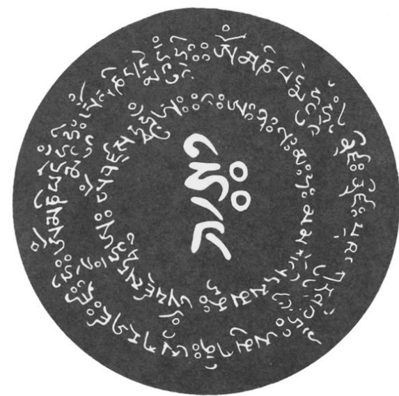
無上密部救拔六趣陀羅尼輪

ནམ་རྒྱུ་ཡུལ། ཨྱི་ཀཱ་ཀཱི་ཀཱ་ཀཱི། རྩ་ཅཱི་རྩ་ཅཱི། ཏྱོ་ཏྱོ་ཅཱི་ཏྱོ་ཏྱོ་ཅཱི། རྩ་ཅཱི་ཏྱོ་ཅཱི། བཅི་ཅཱི་པཅི་ཅཱི། མཅཱི་ཀཱི་བཅཱི་པཅཱི་ཅཱི། མཅཱི་པཅཱི་ཅཱི། རྩ་ཅཱི་ཏྱོ་ཏྱོ་ཅཱི།