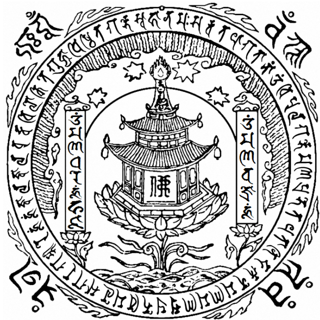
大寶廣博樓閣陀羅尼

根本陀羅尼：曩莫薩嚩怛他萼多南唵尾補擢萼陞麼拏鉢囉陞怛他 多倆捺捨寧摩拏摩拏蘇鉢囉陞尾麼黎娑萼囉儼鼻唵吽吽入嚩擢入 嚩擢沒馱尾盧枳帝慶呬夜地瑟恥多萼陞娑嚩訶 心陀羅尼：唵麼拏嚩日哩吽 隨心陀羅尼：唵麼拏馱哩吽泮吒